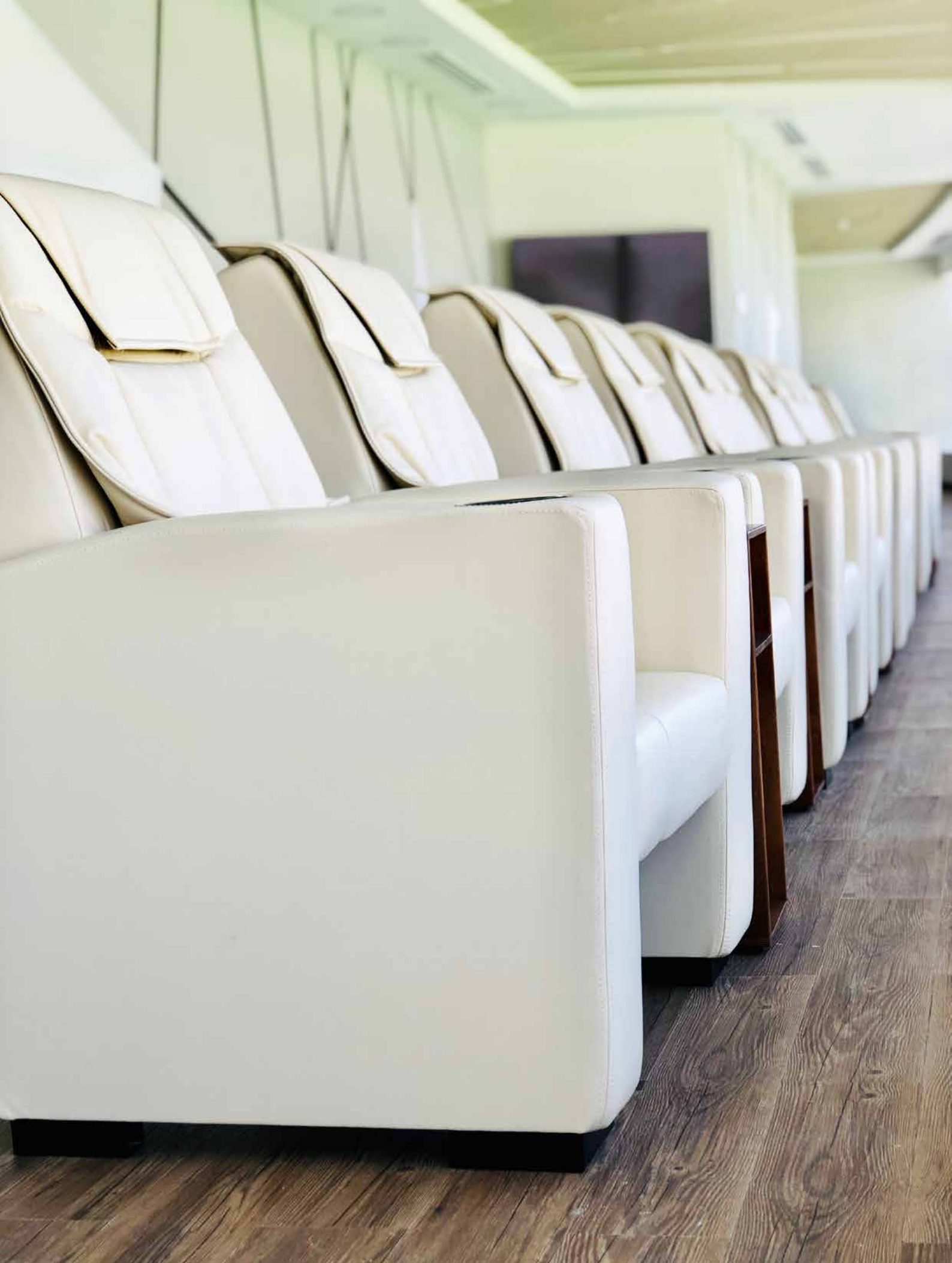
SHARJAH FOOTBALL CLUB - DUBAI - UNITED ARAB EMIRATES