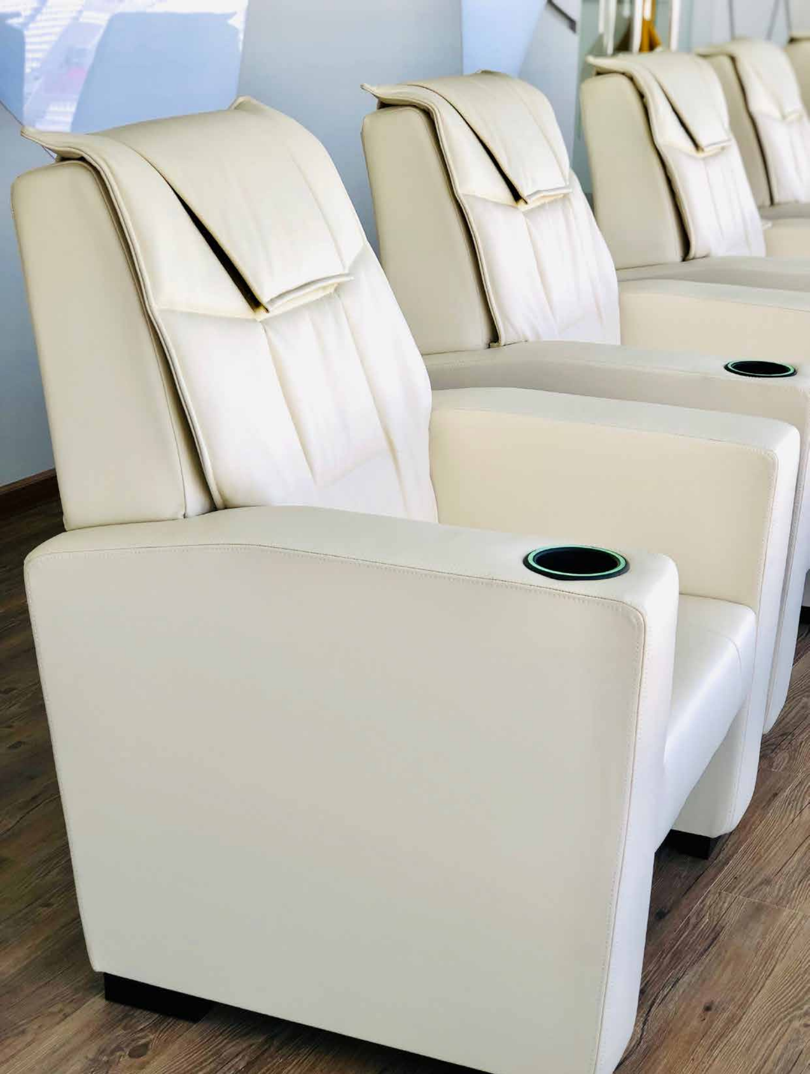
SHARJAH FOOTBALL CLUB - DUBAI - UNITED ARAB EMIRATES