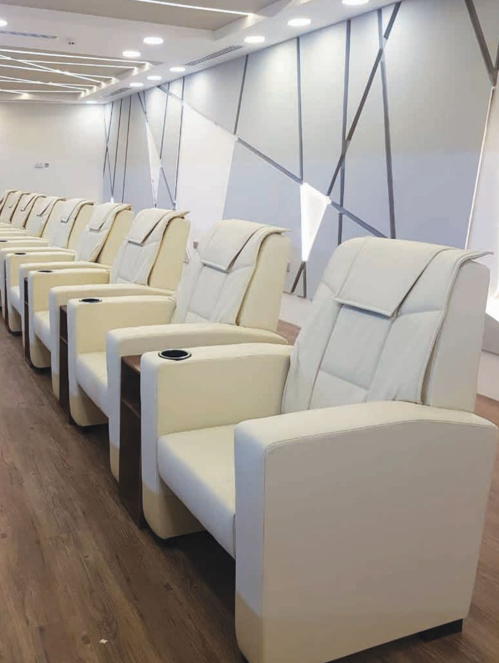
SHARJAH FOOTBALL CLUB - DUBAI - UNITED ARAB EMIRATES