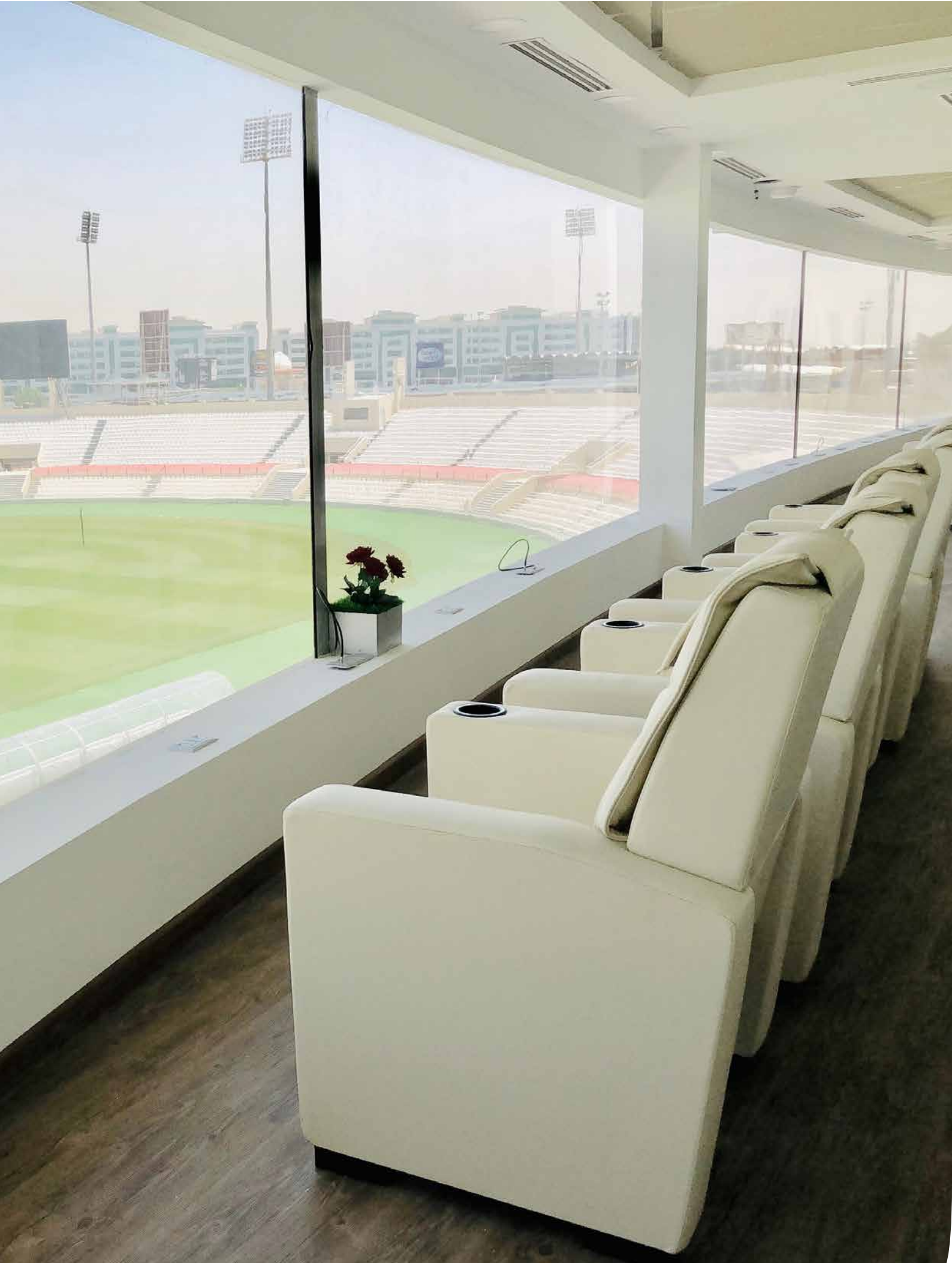
SHARJAH FOOTBALL CLUB - DUBAI - UNITED ARAB EMIRATES