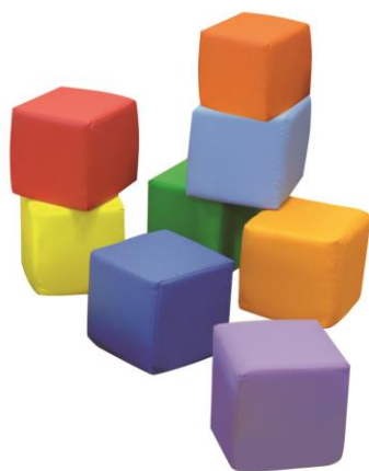
Art. 60013 CUBO - kit 8 pz. Cubo lato cm. 20 Colori assortiti